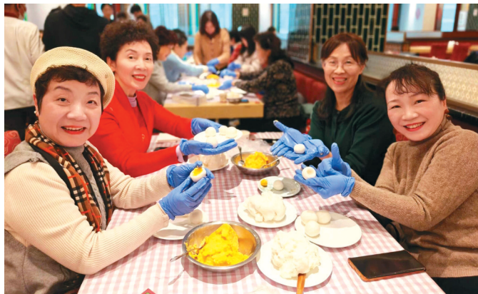
商场内的公益课程

4月22日,石泉路街道社区学校中海真如环宇城MAX校外教学点正式揭牌。作为普陀区首个落地于商业综合体的商教融合校外教学点,标志着石泉路街道在“教育+商业”跨界融合探索上迈出关键一步,不仅把社区教育送到居民“家门口”,也为商业空间导入了学习、社交、消费相互贯通的新要素,推动传统消费空间向集学习、社交、消费于一体的复合型生活场景升级。