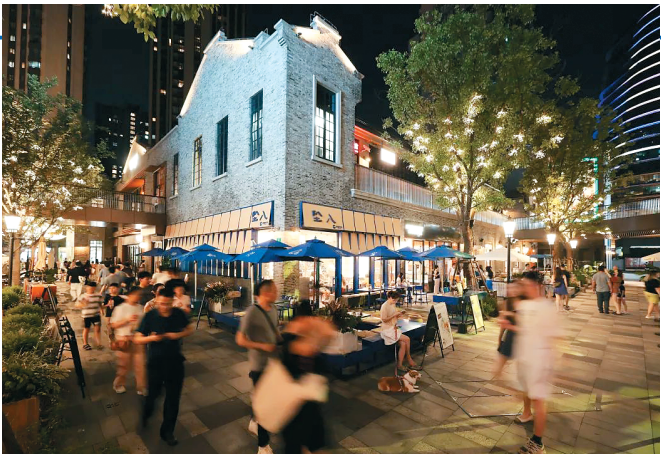
鸿寿坊将聚焦“可持续社区生活方式”理念,开展“绿动生活节”活动