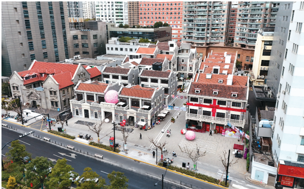
昔步统益里优越的位置、优质的服务吸引商家入驻

接下来,普陀区将继续深化多方紧密合作,通过政策扶持、服务保障、协同联动等方式,全力打造更具吸引力的楼宇经济生态,激发载体活力、放大商圈集聚效应、促进招商招租紧密融合,点面联动,共同书写楼宇经济高质量发展的新篇章,助力上海城市更新。