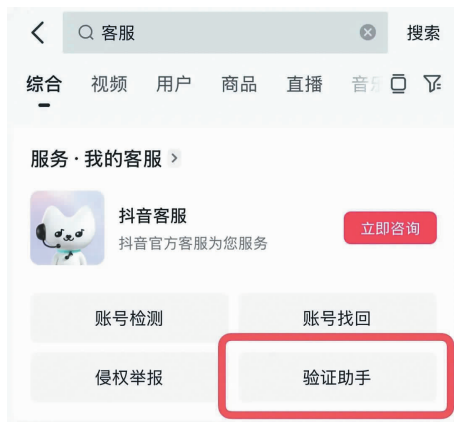
“验证助手”使用指南示意图