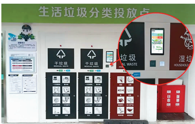
■红外感应、无接触投放

环卫管理科相关负责人告诉记者：生活垃圾分类精品示范居住区项目启动以来，每季度向各