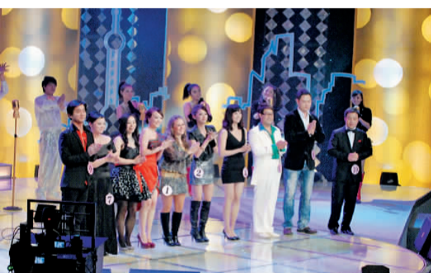
「长风杯」新上海人歌手大赛决赛歌手风采