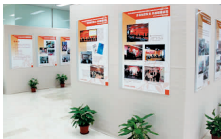
区图书馆于文化艺术节期间举办了“沐浴知识阳光,共建精神家园”图片展,全面展示公共图书馆服务体系的建设成果。