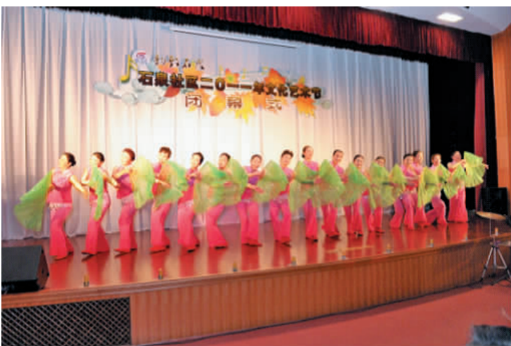
社区文艺团队参加文化艺术节演出