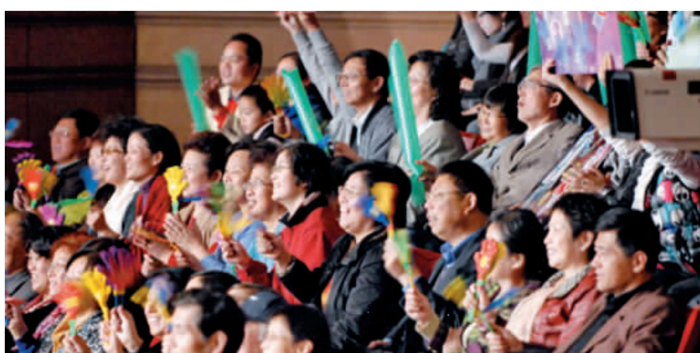
社区居民兴致勃勃观摩2011苏州河文化艺术、旅游、购物节闭幕式暨“长风杯”新上海人歌手大赛决赛