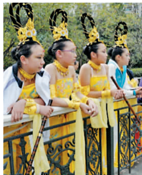
中小学生在文化艺术、旅游、购物节“时尚天天”文艺展演区教育局专场活动