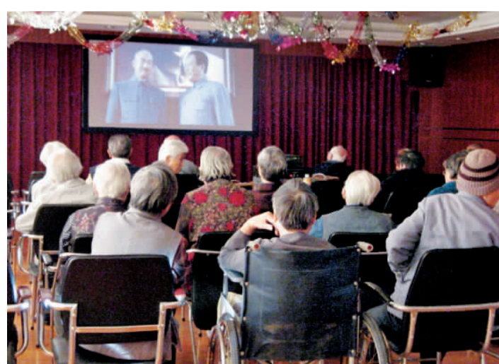
敬老院的老人们在艺术节期间欣赏由沪西电影院配送的公益电影