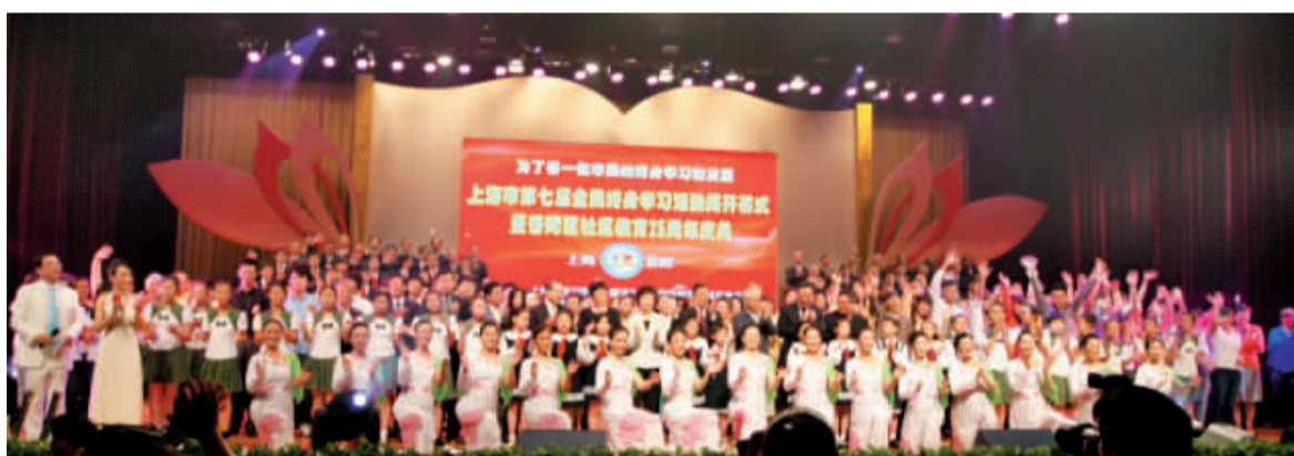
普陀区社区教育25周年庆典活动反映社区教育丰硕成果