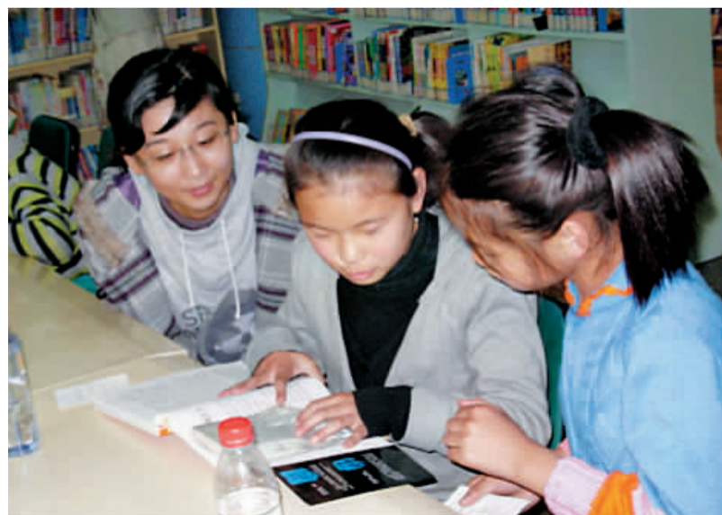
小读者在文化艺术、旅游、购物节期间参加区少儿图书馆举办的“牵手上海”外来务工人员子女图书馆体验活动。