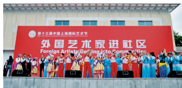
长风社区群众与外国艺术家同台演出,交流技艺