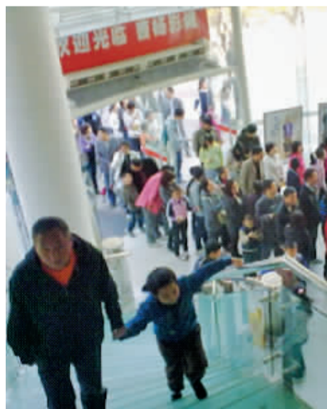
社区群众参加曹杨影城举办的亲子专场公益电影放映活动